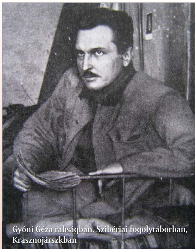
Gyóni Géza rabságban, Szibériai fogolytáborban, Krasznójarszkban

A jubileumi megemlékezés kedvező lehetőséget ad arra, hogy emlékezzünk a sok-sok tízezer Szibériába hurcolt és ott elhunyt magyar hadifoglyokra és azokra is, akiknek a véres és értelmetlen harcok, megpróbáltatások és szenvedések után többnyire hadirokkantként sikerült hazatérniük. (megjegyzés: a hazatérők között néhány akarattyai telepese is volt).