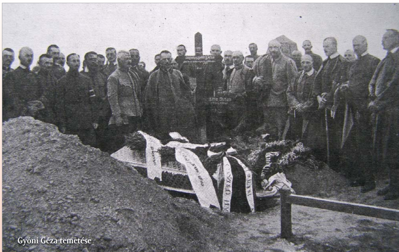
Gyóni Géza temetése