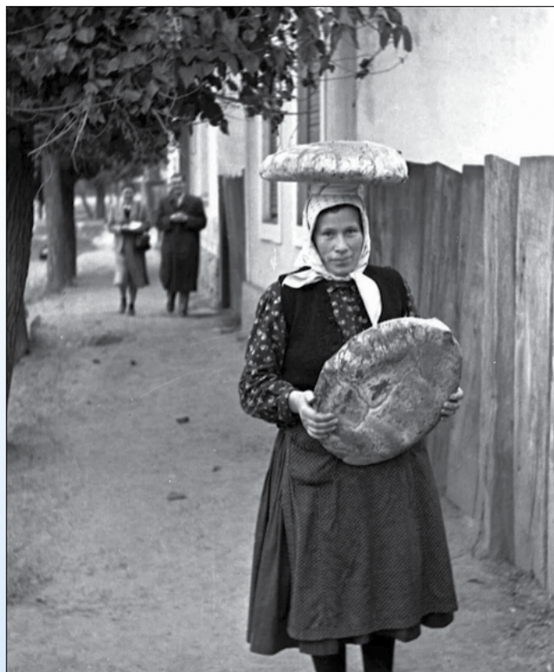
(Fotó: Szolnoky Lajos, Babócsa 1953. Néprajzi M.)

(Agatha Fasset: Bartók amerikai évei. Zeneműkiadó, Budapest, 1960.) – Juhász Katalin: Mindennapi kenyérünk (folkMAGazin 2012/5)