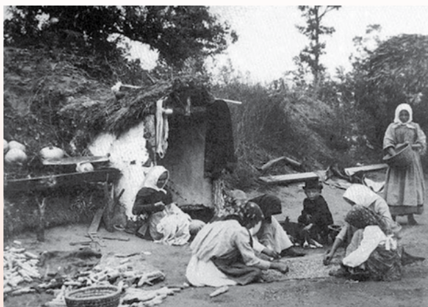
A képen egy földházban élő vákáncsos családja. Debrecen (Hajdú vm.) – Haranghy György felv. 1919. Néprajzi Múzeum, Budapest F 20 993

A vákáncsos szigorú szerződésben állt az erdőgazdasággal. Sem kunyhóját, sem vákáncsföldjét nem adhatta át másnak, kunyhójába idegent nem fogadhatott be, a földet bérbe adni vagy részben kiadni nem lehetett. Az erdősítés befejezése után kunyhóját le kellett bontania, telephelyét köteles volt feltörni és husággal beültetni. A vákáncsost munka- és életkörülményei a teljes elmaradottság és analfabetizmus szintjén tartották. Az elszegényedett parasztok csak a végső esetben választották ezt a megélhetési formát. A debreceni vákáncsosok létszáma 1921-ben megközelítette az ezer családot, majd a későbbi években számuk rohamosan csökkent, az 1940-es években pedig megszünt ez a speciális foglalkozás.