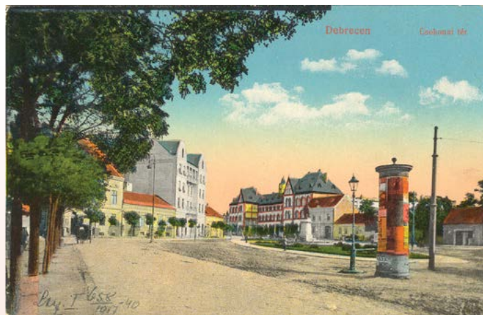
Itt volt az első debreceni használtcikk piac, a cívis nyelvjárás szerint „zsidogó”

1926-ban egy tavaszi napon, több aláírással levél érkezett egy debreceni napilap szerkesztőségébe, melynek tartalma mellbe vágta a szerkesztőséget. Arra hívták fel a levélírók a figyelmet, hogy a debreceni „zsidogón”, vagyis az ócskapiacra „gyerekeket adtak és vettek örök áron”, mint egykor az afrikai rabszolgapiacokon, annyi különbséggel, hogy nem voltak megkötözve.